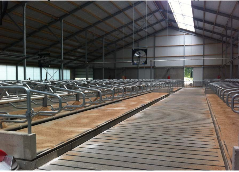
Foto van het vernevelsysteem